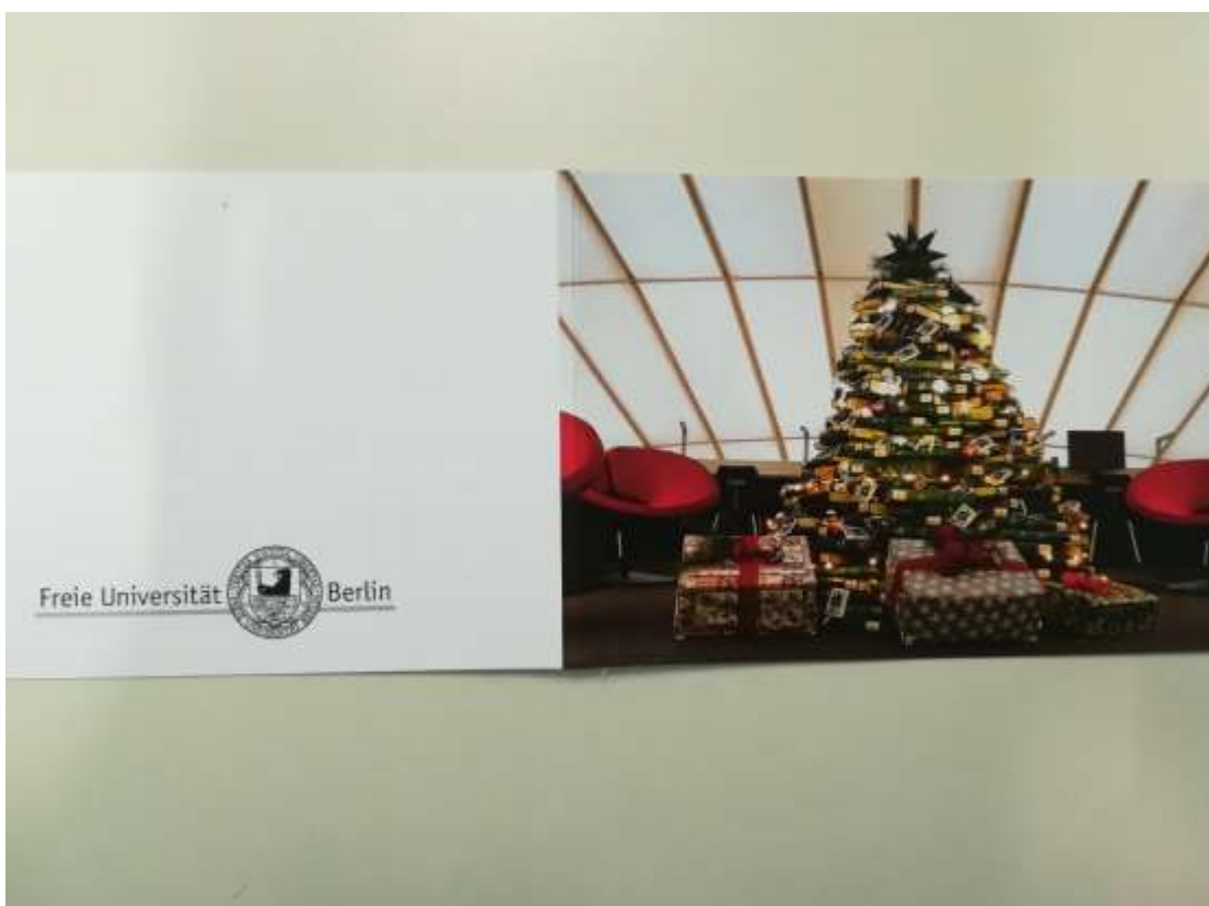
diesjährige Weihnachtspostkarte, sowie Postkartenset mit Aufnahmen der Bibliothek