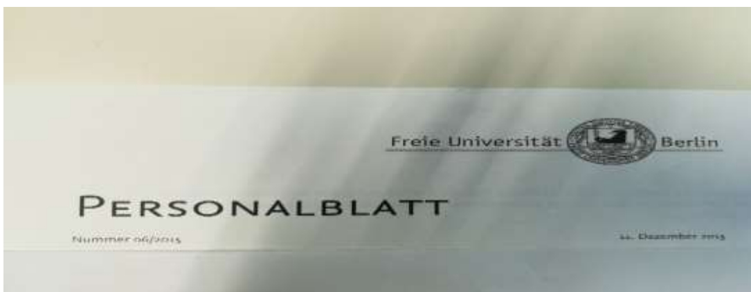
Briefbögen sind im CD Design zu verwenden, alle Mitarbeiter haben Zugriff darauf