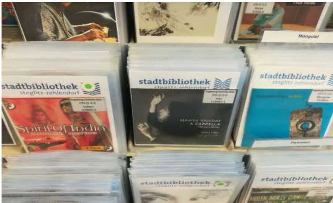
schön ist hier die Verwendung des Logos auf allen AV-Medien Hüllen

Ich hätte vermutet, dass die Bibliothek auch viele verschiedene Artikel mit ihrem Logo parat hat wie z.B. Lesezeichen, Visitenkarten, Luftballons, UBS Sticks, Aufkleber, Buttons etc. die bei Veranstaltungen gerade mit Kindern und Jugendlichen verteilt werden. Dem ist nicht so, so zumindest die Aussage eines Jugendbibliothekars vor Ort.