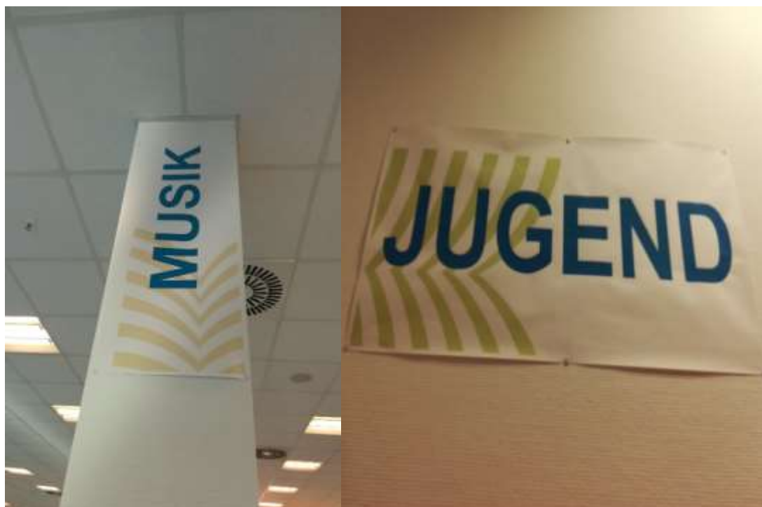
Wiedererkennung des Logos am Leitsystem, allerdings wird dies nicht in der ganzen Bibliothek vollzogen, Regalbeschriftungen sind ohne CD gestaltet