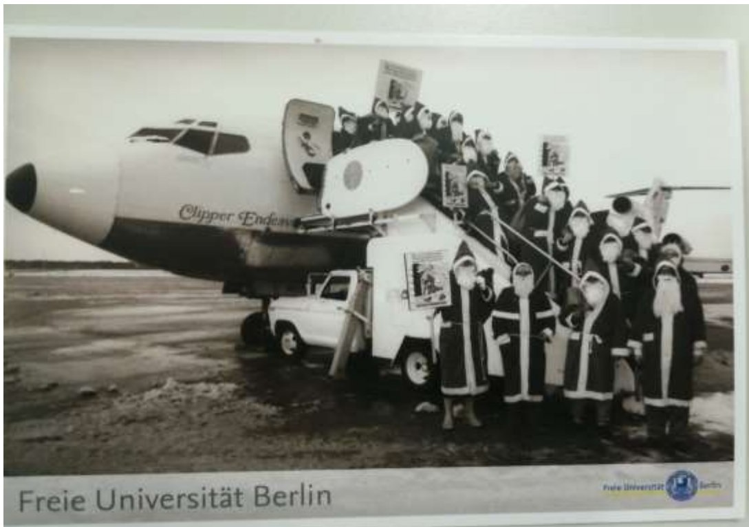
diese Postkarte gibt es im hiesigen "Uni-Shop" der FU zu erwerben