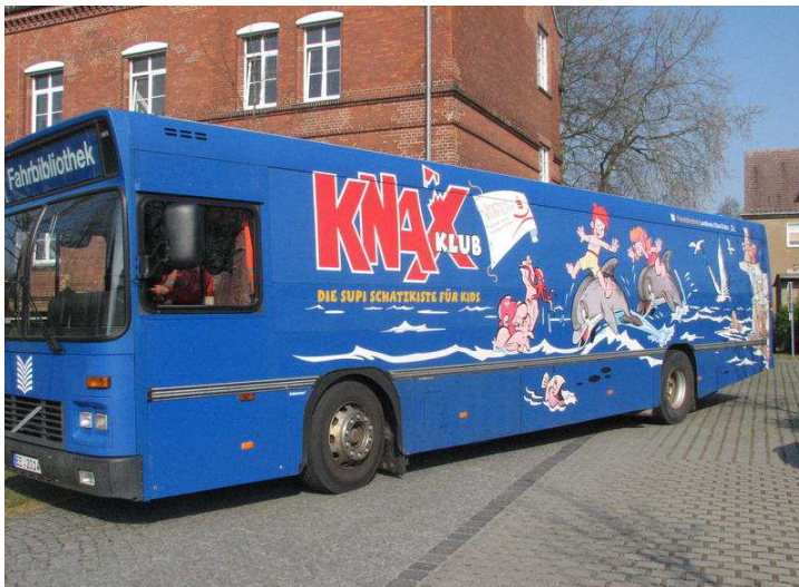
Abb. 3: Fahrbibliothek Elbe-Elster

Diese Form des Sponsorings ist bei vielen Fahrbibliotheken zu beobachten. Aufgrund der Großen Fläche und Reichweite, findet sich schnell ein Sponsor. Hier als weiteres Beispiel für die Zusammenarbeit von Fahrbibliothek und Sparkasse ist die Bibliothek in Elbe-Elster. Auch hier ist die Werbung des KNAX-Klub nicht zu übersehen.