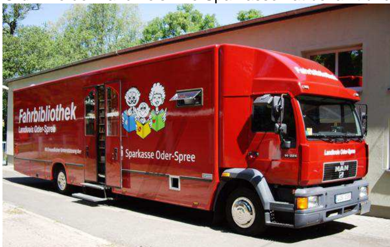
Abb. 2: Fahrbibliothek Landkreis Oder-Spree 2016

Im Laufe der Jahre rostete unsere Karosserie zu sehr und musste generalüberholt werden, damit wir überhaupt weiter fahren konnten. Da dies außerplanmäßig geschah, war natürlich kein Cent mehr da um die Fahrbibliothek lackieren zu lassen. Ich erstellte eine „Werbemappe“ für die Sparkasse in der aufgeführt wurde, welche Reichweite die Werbung auf der Fahrbibliothek hat und warum sie unbedingt neu lackiert werden muss. 2014 gaben sie uns kurz vor unsrem Jubiläum das Geld für Lackierung und Beschilderung. Das ist auch der Grund, warum wir Rot sind und nicht Grün wie der Landkreis. Die Sparkasse hat bezahlt und durfte die Farbe auswählen.