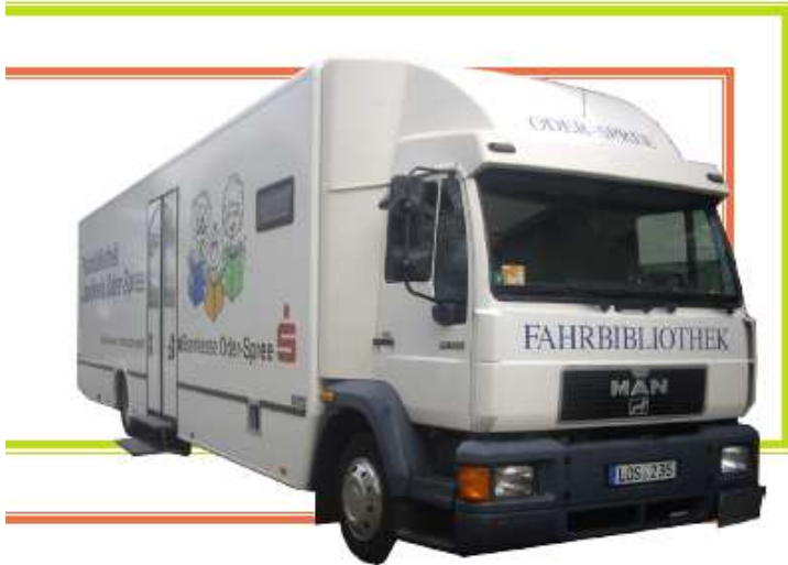
Abb. 1: Fahrbibliothek Landkreis Oder-Spree 2012

Die Sparkasse Oder-Spree unterstützt unsere Fahrbibliothek schon seit 1994. Die Anschaffung eines neuen Fahrzeuges ist sehr kostenintensiv (unsere neue geplante Fahrbibliothek liegt aktuell bei 450 000€). Von daher ist bei der Gestaltung der Karosserie häufig kein Geld mehr da. Unser Fahrzeug ist eigentlich komplett weiß ohne Aufdruck. Die Sparkasse Oder-Spree finanziert unser Aussehen. 1994 hat sie unseren ersten Aufdruck bezahlt. Damals haben Sie 50000 DM gesponsort.