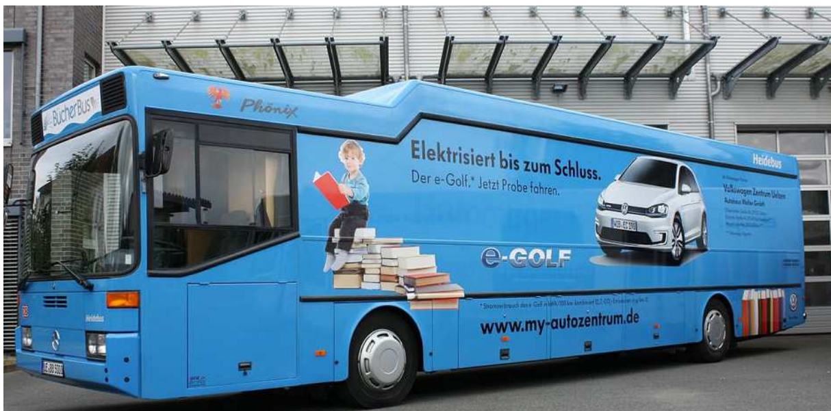
Abb. 4: Fahrbibliothek Uelzen